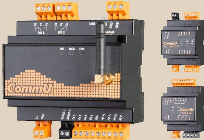
Communication Center CommU und Erweiterungsmodule