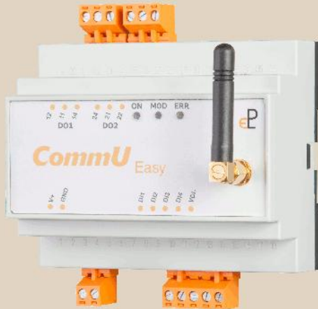
Communication Center Easy