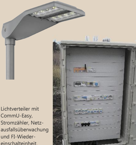
Lichtverteiler mit CommU-Easy, Stromzähler, Netzausfallsüberwachung und FI-Wiedereinschalteneinheit.