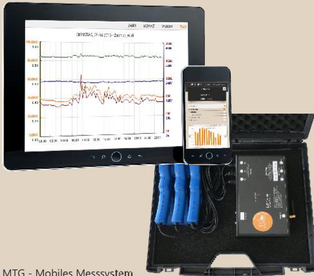
MTG - Mobiles Messsystem