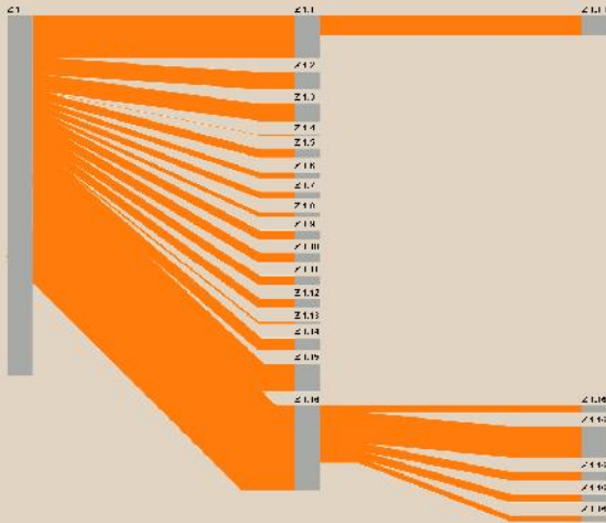
Automatisch erstelltes Energieflussdiagramm